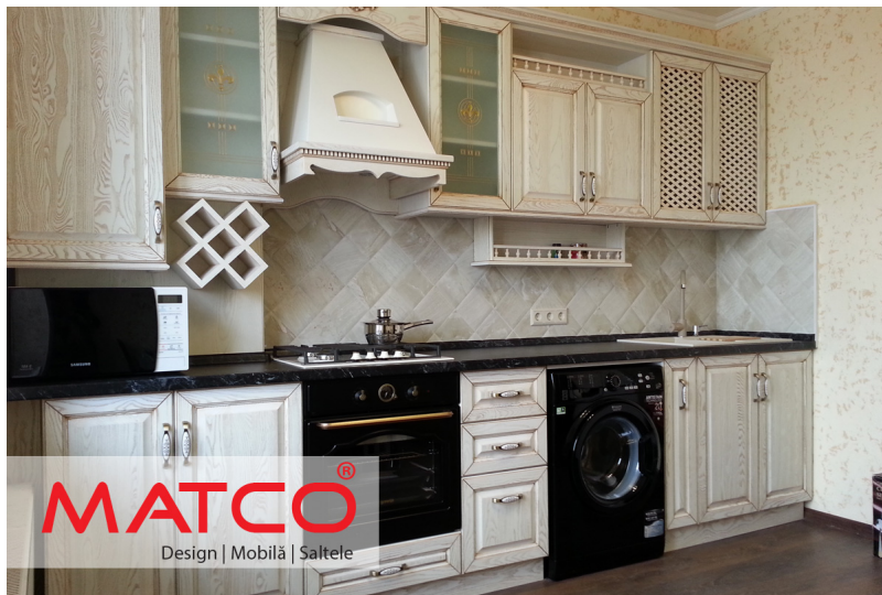
MOBILA LA COMANDA